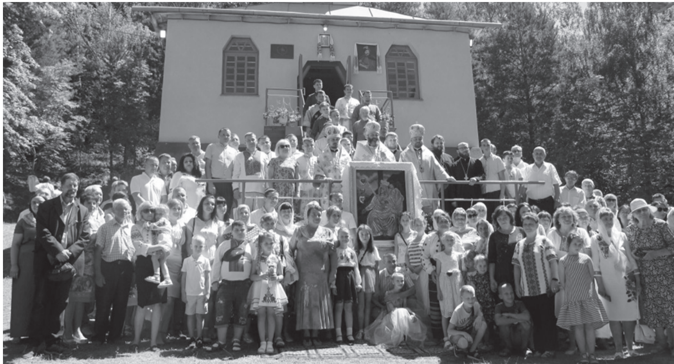
Закінчення. Початок на с. 7